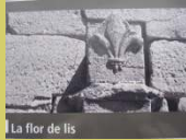
La flor de lis

Este símbolo representa una flor, ¿cuál?. LA FLOR DE LIS. "Lis" en gallego significa lirio.